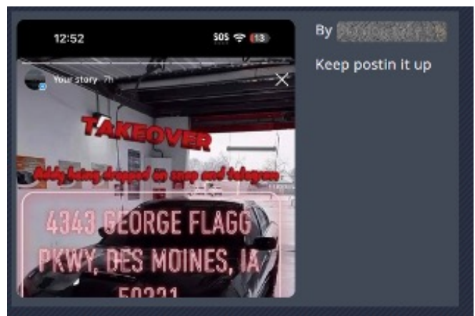
テイクオーバーの場所を宣伝するチラシ

こうした集会は一見自然発生的に見えますが、実は計画的で、ソーシャルメディアを通じて違法集会のフォロワーや参加者に向けて宣伝されています。主催者は、「Project X」 3 「takeover」「carmeeet」という表現を使いながら、事情通のフォロワーにすばやく情報を広めることができます。また、テイクオーバーが行われる詳しい場所と時間を記載したチラシの画像も投稿され、多くの場合 #takeover、#sideshow、#slideshow、#getbackorgetsmacked などのハッシュタグが付いています。